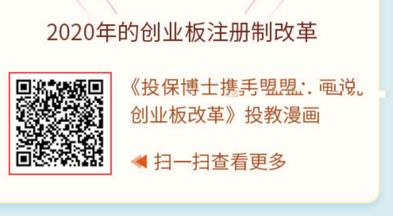
2020年的创业板注册制改革

第二，创业板主要服务成长型创新创业企业，对需要融资和发展的企业提供融资途径和成长空间。